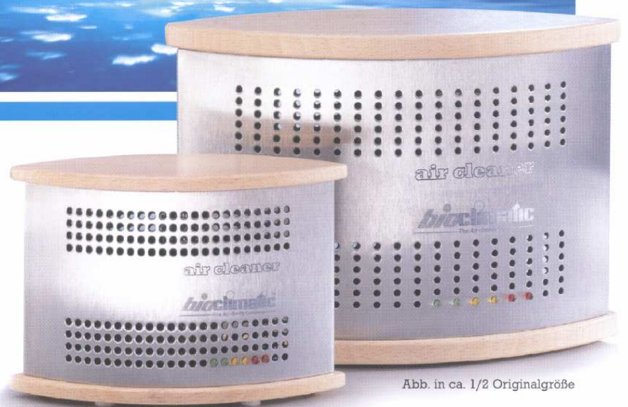
Abb. in ca. 1/2 Originalgröße